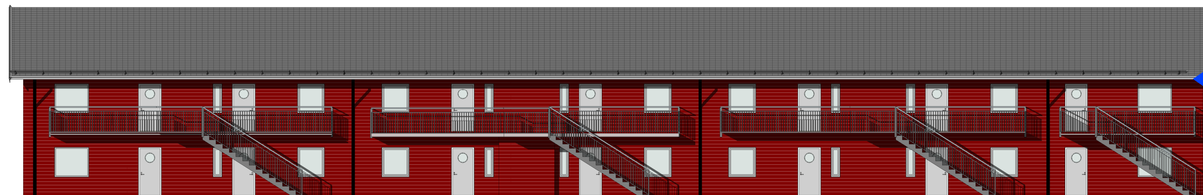
FASAD MOT SYDOST