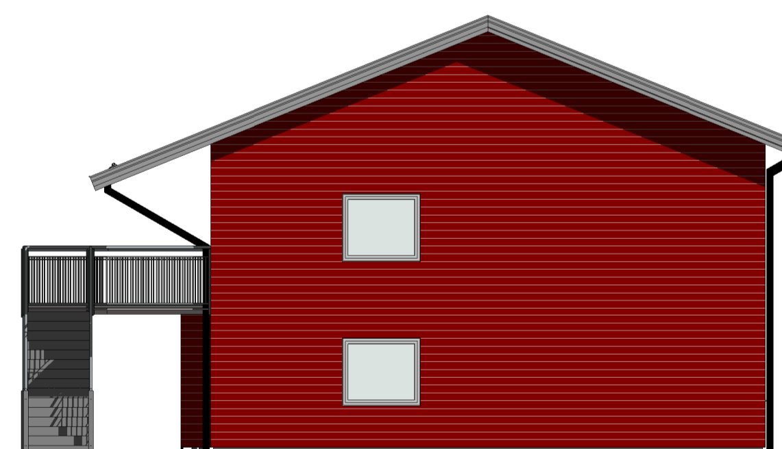
FASAD MOT NORDOST